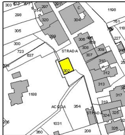
Estratto di Mappa Catastale